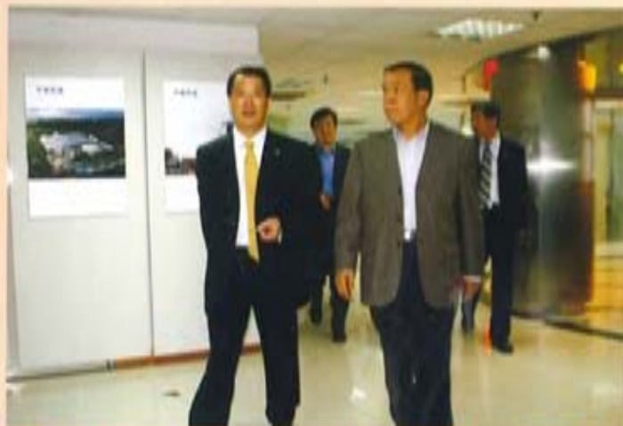
中国建材工业协会会长张人为视 察南京凯盛（右图）