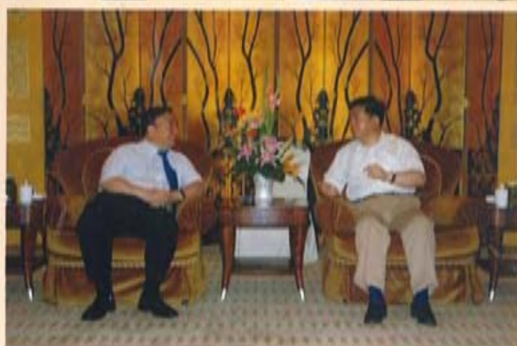
中国建材集团董事长宋志平分别与沈阳市市长李英杰（左图）、徐州市市委书记徐鸣（右图）进行亲切交