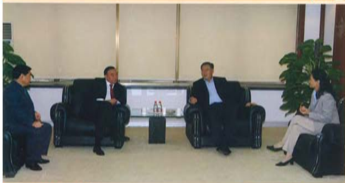
国资委副主任王瑞祥听取 中国建筑材料集团公司汇报