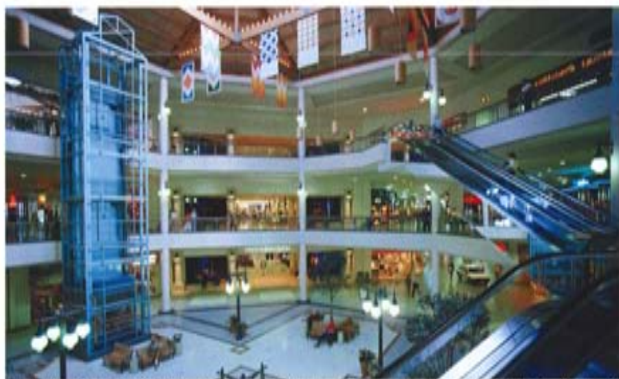
中国凯盛将下属企业资源进行了重组，整合出玻璃、水泥、建筑“三大主业”和工程、机电、材料、环保“四大平台”，通过近两年的运作，各大业务平台的经济效益都显著提高

战略抓住“建材技术”这个发展龙头，提出“研究开发、工程设计、工程承包和加工制造”等相关业务都要全面发展，明确了做大做强企业的愿景。