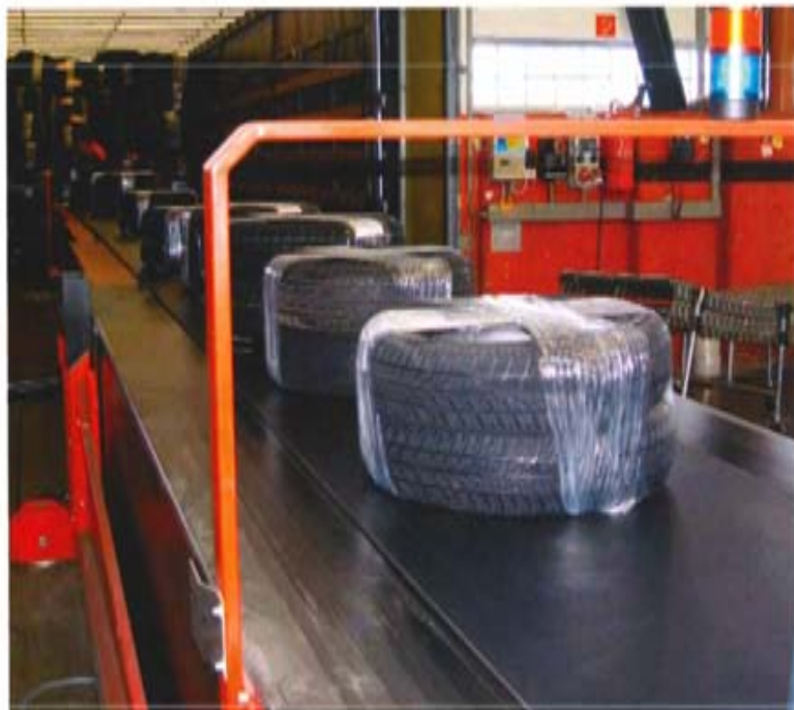
日本最大的水泥厂——三菱九州工厂积极推进废轮胎、下水道淤泥等废物的利用

在建材企业中也开发建立一系列的资源与能源循环系统,尤其是水泥行业可以起到很大的作用。合肥水泥研究院正在开发水泥生产结合垃圾焚烧的技术。从窑头中出来的热气使垃圾燃烧,由于垃圾本身含有相当的能量,产生的热量用以加热水泥原料,垃圾的焚烧残留物进入回转窑内直接用作水泥的原料,最终达到既消化了垃圾,又利用了垃圾的热量和剩余组分,实现了资源和能源的充分利用。北京水泥厂则在利用印染业废料作为补充能源烧制水泥方面作了很多