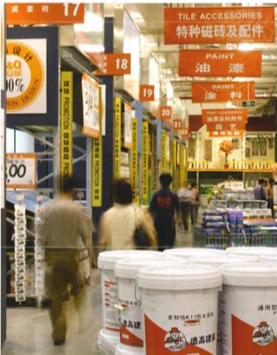
立足于促进整个建材行业快速稳步发展的高度，充分整合存量资产，最大限度地发挥现有资源的潜能，充分发挥中国建材的控制力、影响力、带动力和行业引领者的作用

速稳步发展的高度，充分整合存量资产，最大限度地发挥现有资源的潜能，充分发挥中国建材的控制力、影响力、带动力和行业引领者的作用，为我国建材工业在重要的战略机遇期内基本完成产业结构调整，优化资源配置的历史重任做出更大贡献。