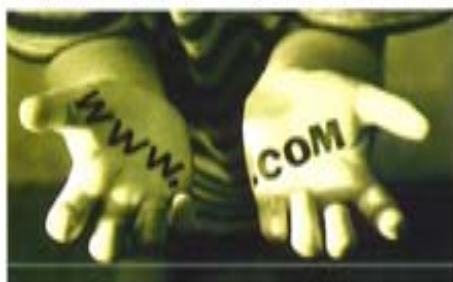
随着网络技术和电子技术的发展,人类将从传统的购买行为逐步进入电子商务时代

(2) 储存功能 电子商务既需要建立因特网网站,同时又需要建立或具备物流中心,而物流中心的主要设施之一就是仓库及附属设备。需要注意的是,电子商务服务提供商的目的不是要在物流中心的仓库中储存商品,而是要通过仓储保证市场分销活动的开展,同时尽可能降低库存占压的资金,减少储存成本。因此,提供社会化物流服务的公共型物流中心需要配备高效率的分拣、传送、储存、拣选设备。在电子商务方案中,可以利用电子商务的信息网络,尽可能地通过完善的