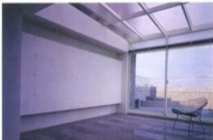
科学发展观给建材提供了发展空间

中国建材集团这样的项目还不少。最近他们在苏州收购的一个企业，采用新技术把炼钢厂的废料制作成岩棉。过去普遍的做法是买钢厂冷却的钢渣，粉碎后再进炉用焦炭加热。如今能源产品价格猛涨，焦炭已经1300块钱一吨，生产一吨岩棉成本要700多块钱，采用新技术成本只要三四百元。宋志平自豪地说：“建材企业可以吃掉炼钢厂所有的废物，用来做水泥辅料，保温材料，吸音材料等等。我们集团的几个主要产品把城市工业的废弃物都利用了，最近在研究把废木料废塑料磨成