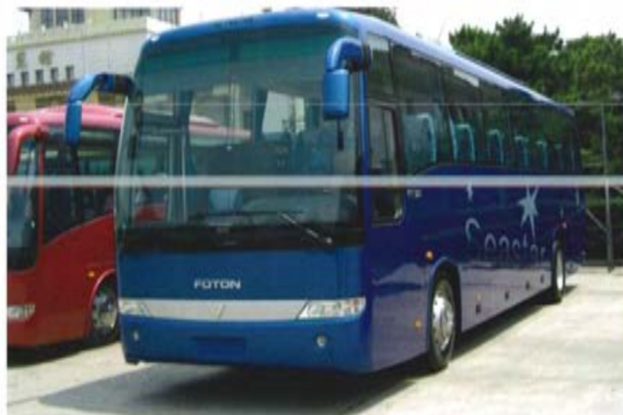
北京汽车玻璃钢有限公司建成了5条单机年产10万件大型SMC制品的规模化生产线，并在北汽福田汽车有限公司、南京依维柯汽车有限公司等新型车的零部件上获得成功应用

面对国外同行业技术不断有所突破和国内市场竞争日益激烈的双重压力，十几年来，按照中国复合材料集团公司所确定的战略方针，北京汽车玻璃钢有限公司坚持“市场导向，追求卓越”的经营理念，秉承“以人为本，社会和谐”的管理思想，瞄准市场，重视人才，强化科研技术开发，以发展的眼光，加强国际合作，以不断的业绩继续领跑于国内SMC行业。