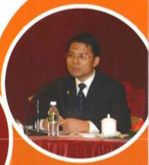
中建材进出口公司经验交流