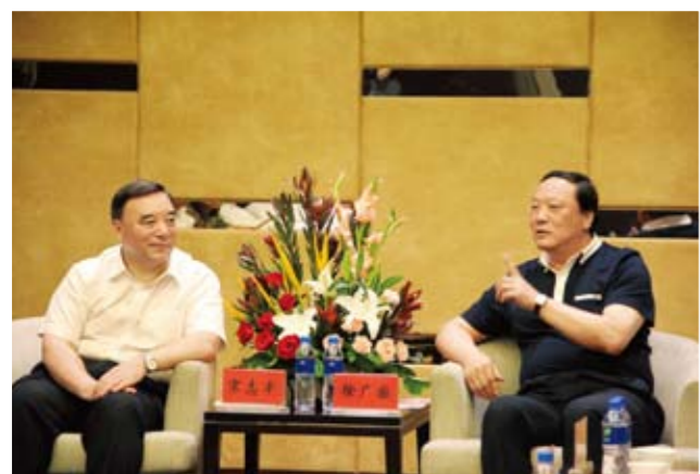
中国建材集团、国药集团董事长宋志平与宁夏回族自治区党委常委、银川市委书记徐广国进行友好会谈